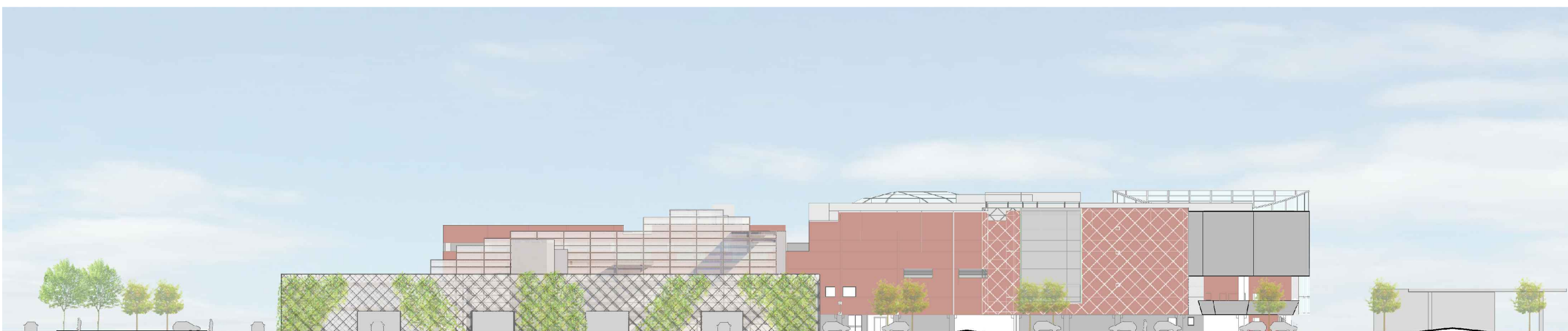
SEZIONE AMBIENTALE DD