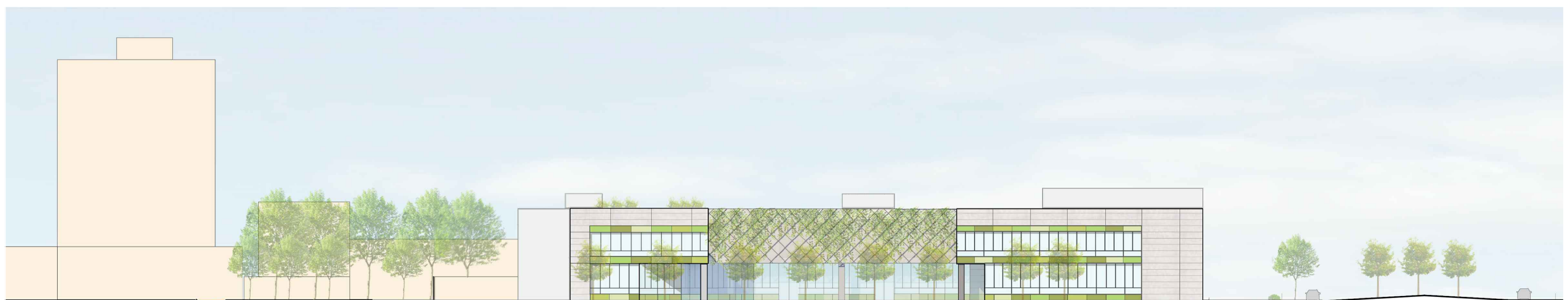
SEZIONE AMBIENTALE CC