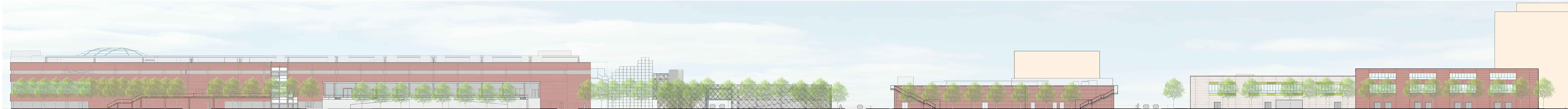
SEZIONE AMBIENTALE AA