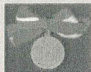
Premio Isimbardi 2009