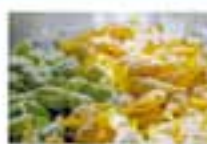
Pasta fresca fatta in casa