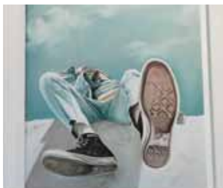
2° Premio – Titolo Opera "All Star" di Alessandra Chiesa