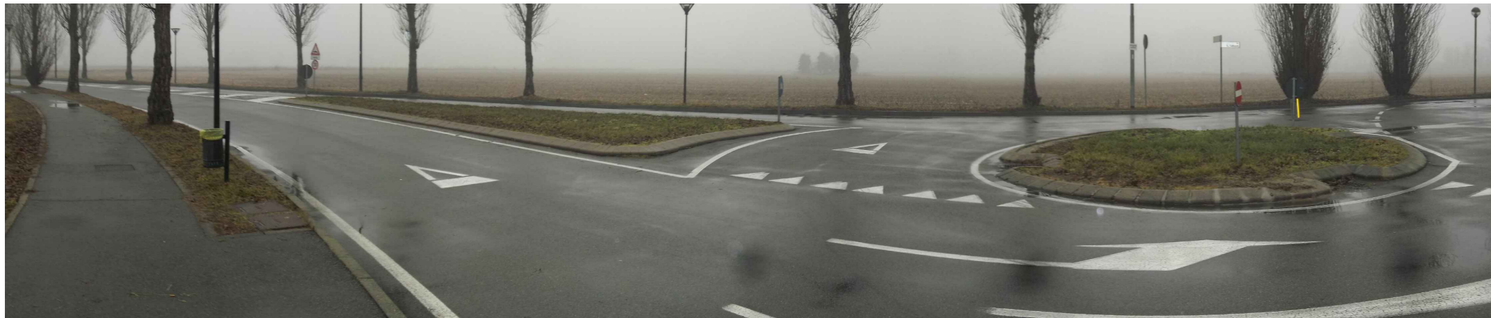
Vista 2 - Rotatoria incrocio tra via Galvani e via Fermi