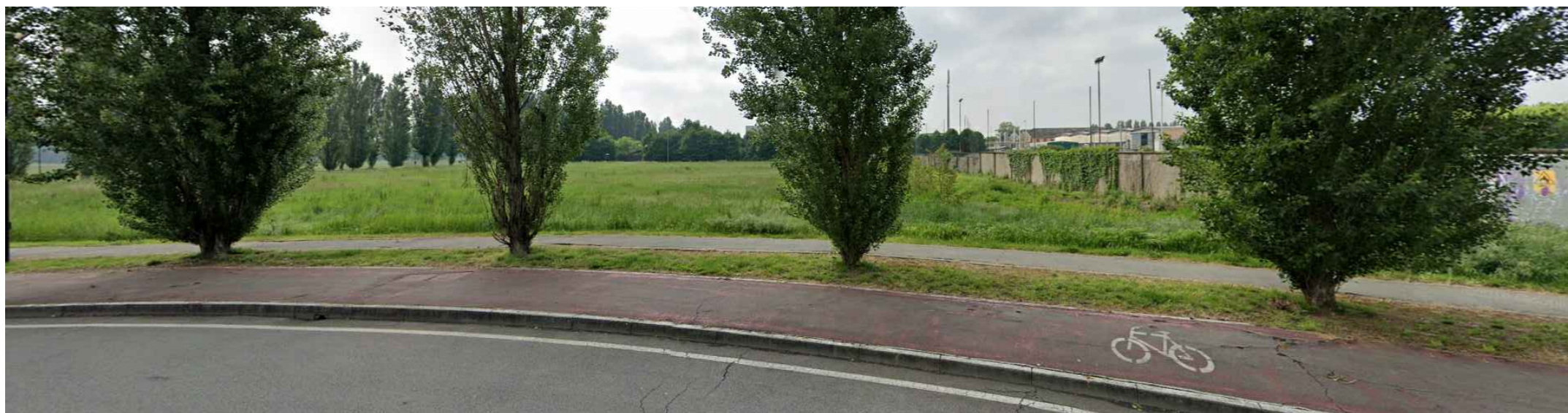
Vista 4 - Area intervento a nord-est da via Mazzola