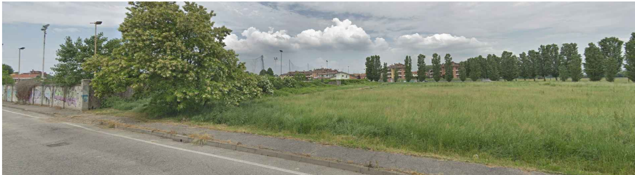
Vista 3 - Zona arbustiva a sud-est dell'area di intervento