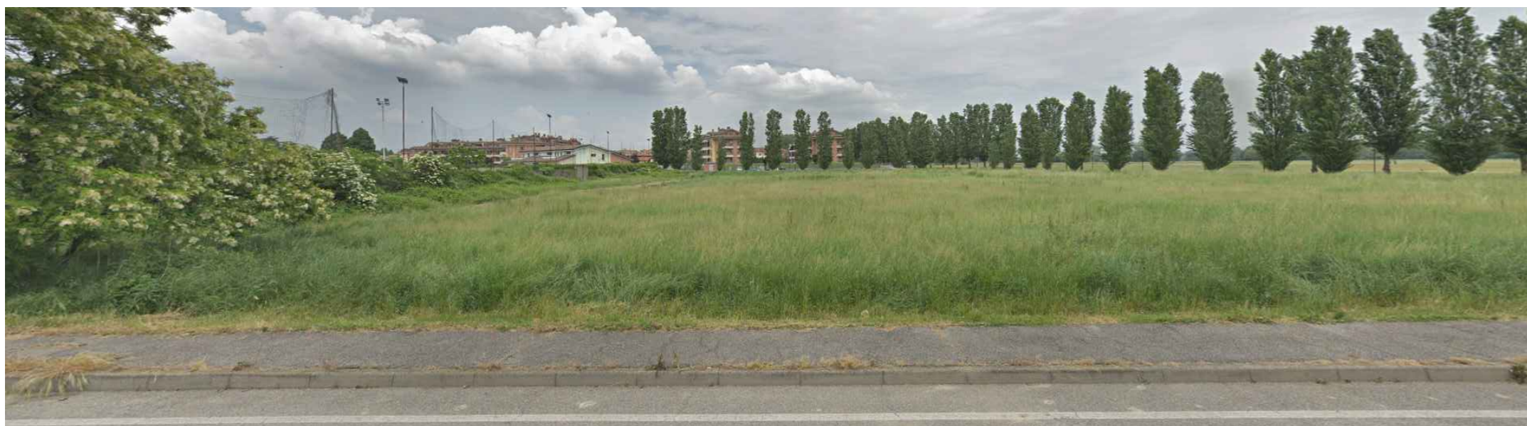
Vista 1 - Area di intervento complessiva da via Fermi