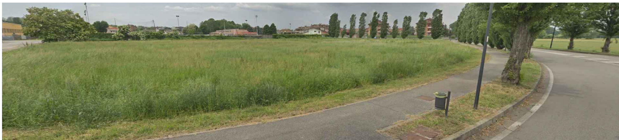
Vista 6 - Area di intervento complessiva da nord-ovest