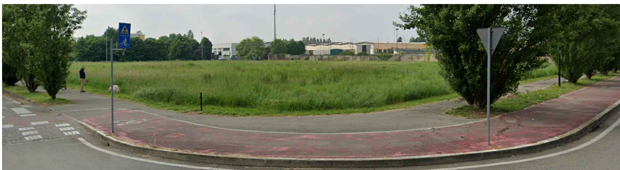
Vista 7 - Area di intervento complessiva da sud-est