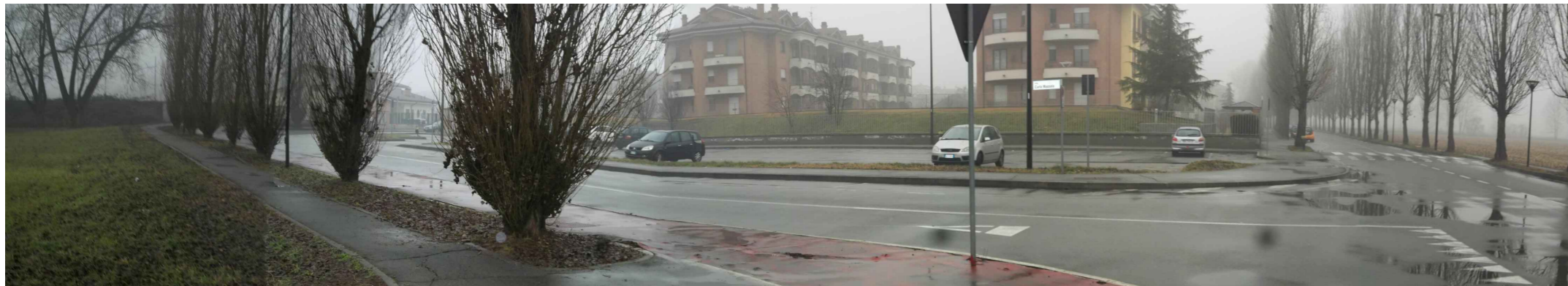
Vista 5 - Parcheggio a nord dell'area di intervento